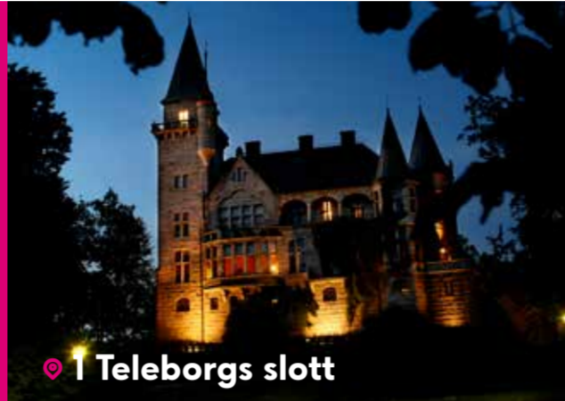
1 Teleborgs slott

Upplev.vaxjo.se är en informationskälla för alla som vill uppleva Växjö med omnejd. Här hittar invånare, besökare och turister kultur, idrott, aktiviteter, evenemang, äventyr, boende, restauranger, naturupplevelser och mycket mer.