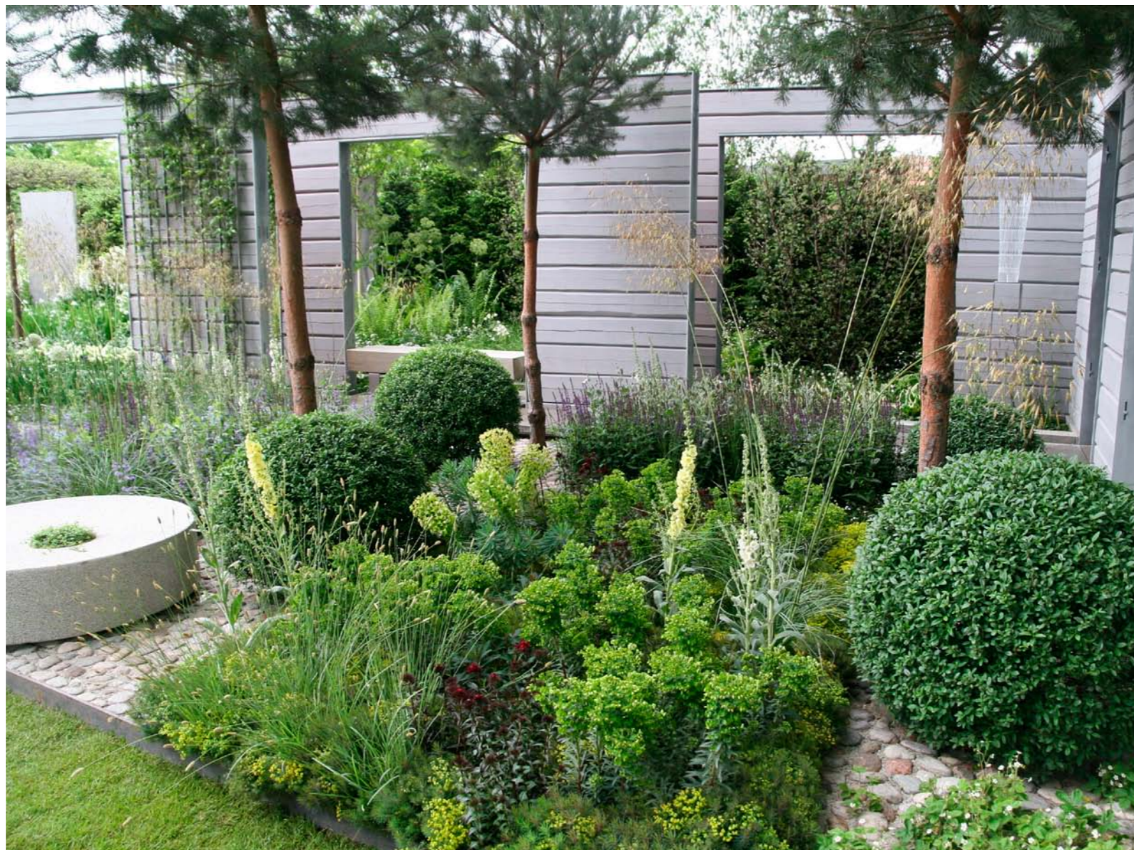
Bilderna i den här foldern visar trädgården som den såg ut när den fanns i Chelsea och Göteborg.

I Linnéträdgården möts modern arkitektur, konst och design i traditionella svenska material som granit, timmer och stål med lingon och andra välbekanta vilda växter. Här finns också äldre arter från Linnés tid, som till exempel vit krollilja, hasselört, hammarbytaök och förstas linnean – den egna blomman. Linné var även läkare och i trädgården återfinns medicinalväxter som stjärnflocka och fingerborgsblomma som han själv odlade i Uppsala botaniska trädgård.