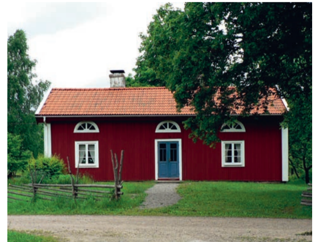
Knutsgård utgör ett fint exempel på en samlad gårdsmiljö från 1800-talet, med boningshus, ladugård och källare. Boningshuset är en välbevarad, timrad parstuga byggd kring år 1850, med tegeltak, blåmålade pardörrar och locklistpanel i falurött.

Skirviken är den södra änden av den lilla sjön Trummen. Viken kantas av vassklädda gungflyn med vitmossor, tranbär och tuvull. Här häckar bland annat trana och brun kärnhök. Kärnhöken kommer ofta glidande på låg höjd. Sävsparv och rörsångare är vanliga småfåglar i vassen.