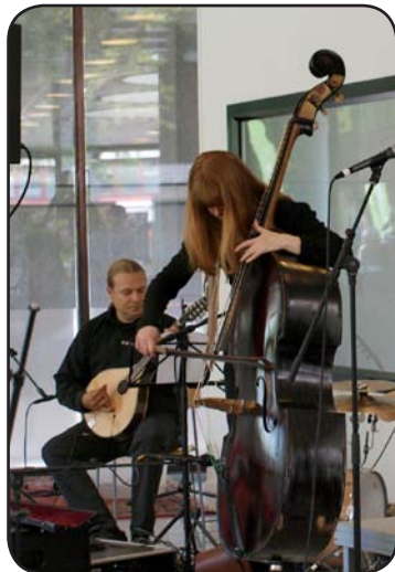
En förening kan arbeta med att göra konserter.

Varje år skriver revisorn en revisionsberättelse.