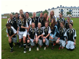
TC:s tjejlag SM-finalen 2011

Som profilelev går du i vanlig klass men har minst ett pass om 80 minuter med fotbollsriktad undervisning per vecka. Vissa veckor ligger två pass samt att det ligger ett antal temadagar med fotbollsriktning under läsåret.