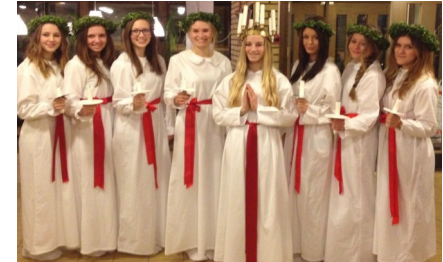
TC:s uppskattade luciatåg.

Vi arbetar efter Sv FF:s "Fotboll i Grundskolan" för att ge dig bästa möjliga förutsättningar för fortsatt fotbollsverksamhet på gymnasienivå.