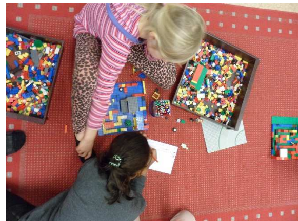
Programmering med lego.