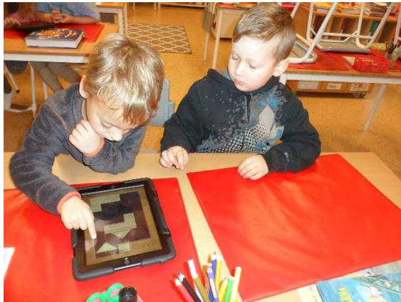
Problemlösning på Ipad.