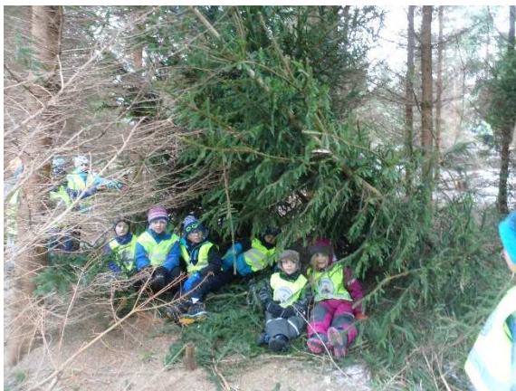
Kojbygge i "labyrintskogen".