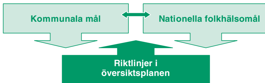
Bild: Koppling mellan kommunala/nationella mål och riktlinjer i översiktsplanen.

Tre av de nationella folkhälsomålen bedöms ha direkt eller indirekt koppling till den fysiska planeringen; Delaktighet och inflytande i samhället, Sunda och säkra miljöer och produkter och Ökad fysisk aktivitet. Nedan beskrivs kopplingen mellan kommunala övergripande mål och de nationella folkhälsomålen. Under respektive målområde redovisas hur översiktsplanens riktlinjer bedöms bidra till dessa mål. Ofta kan en riktlinje bidra till flera mål men nedan finns varje riktlinje med endast en gång.