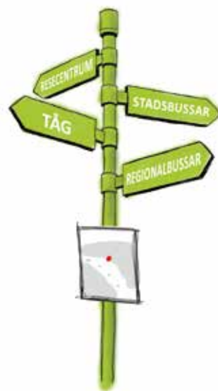
Illustration visar hur skyltning kan se ut.