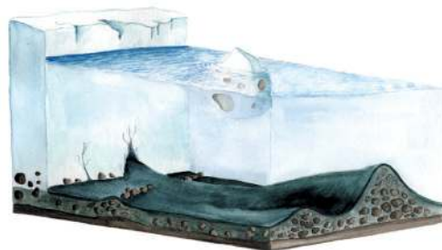
Braåsen är inlandsisens verk. Inne i isen forsade isälvar fram och förde med sig material till iskanten, där det sjönk till botten och bildade åsar.

I reservatets västra del ligger Braåsen – en rullstensås som inlandsisen lämnat efter sig. Går du utmed åsen om våren kan du få se backsippa och blåsippa. Lite senare blommor gullviva, vårärt och den ovanliga smalbladiga lungörten. Uppe på åsen, bland gamla tallar, blommor kattfot på försommaren.