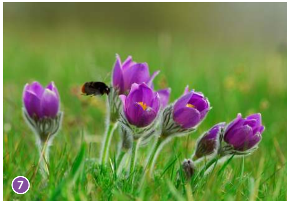
1. smalbladig lungört 2. lunglav 3. rödstjärt 4. makaonfjäril 5. oxtungsvamp 6. guldsandbi 7. backsippa