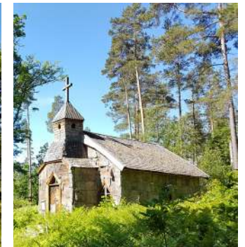
Lusthuset och Eremithyddan - två av reservatets mer udda byggnader som friherre Rappe lät uppföra i början av 1800-talet.