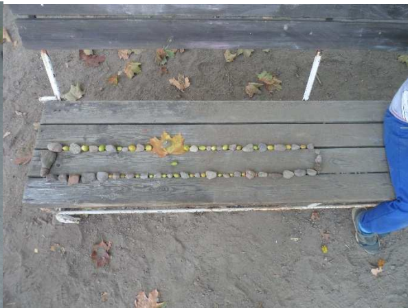
Vi jobbar med mönster.