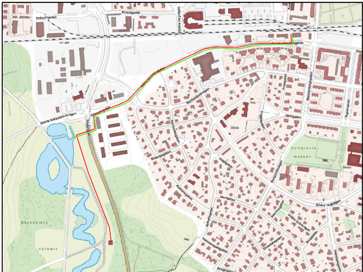
Karta 1: Planerad sträckning av ledningarna visas som grön och röd linje i kartan ovan.

De nya ledningarna börjar strax väster om korsningen mellan Södra Järnvägsgatan och Liedbergsgatan och följer Södra Järnvägsgatan västerut mot Söderleden. Strax innan Söderleden viker ledningarna av och korsar Söderleden söder om Infanterigatan. Därefter följer ledningarna grusvägen genom Bäckaslövs våtmark söderut till den nyligen byggda huvudpumpstationen för spillvatten som står i Bäckaslövs våtmark. Kartan nedan visar ledningssträckningen.