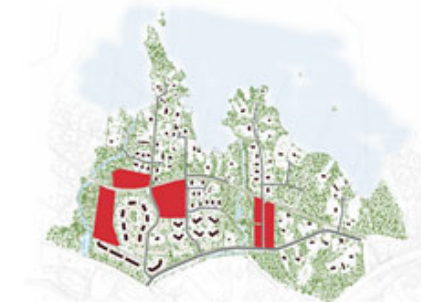
Radhus och låga (3 vån.) flerbostadshus