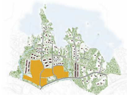
Flerbostadshus upp till 4 respektive 6 våningar

Där finns även utredningar och annat underlagsmaterial i ärendet.