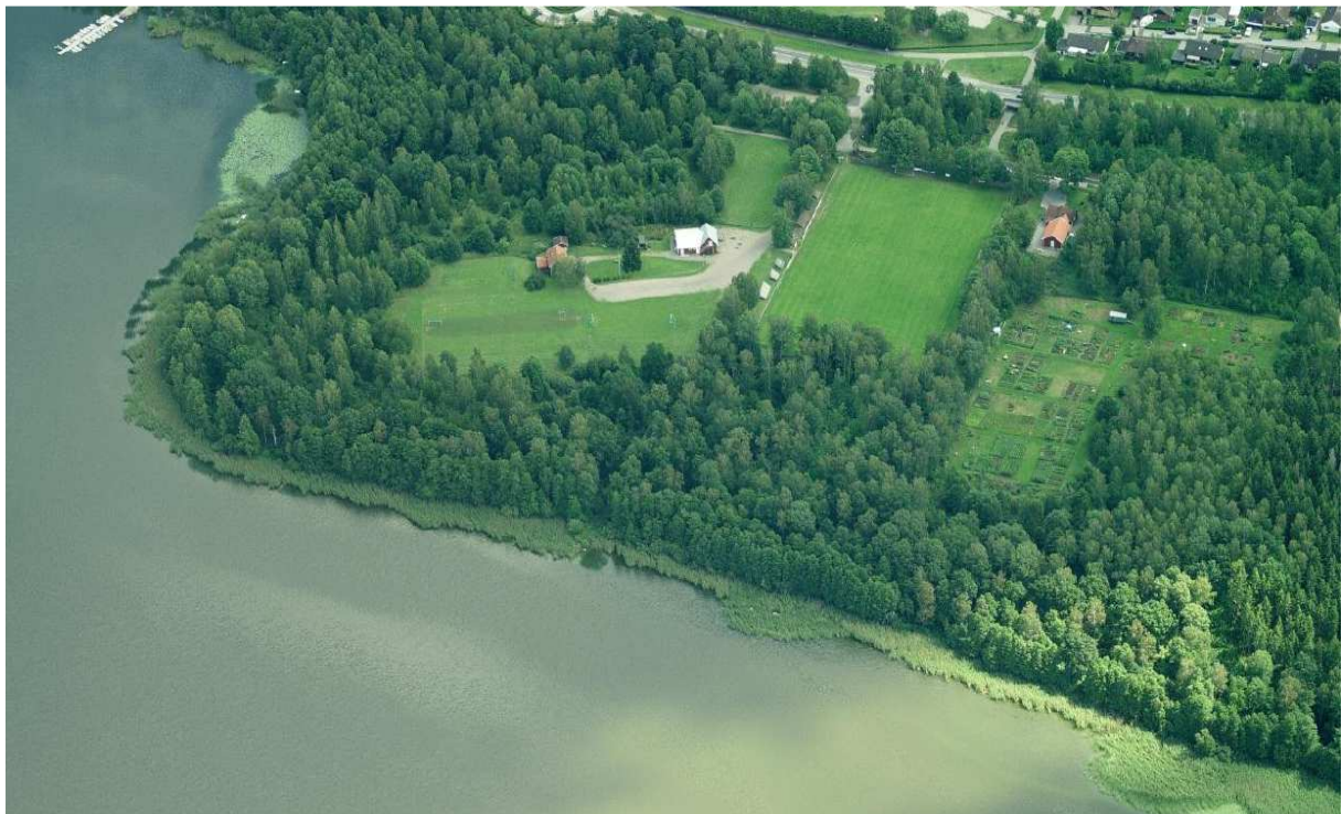
Bild: Flygfoto över delar av Torparängen

Växjö kommunfullmäktige fattade i juni 2014 beslut om en åtgärdsstrategi för bland annat Södra Bergundasjön. Övergödningsproblemen med kraftiga algblomningar ska minska kraftigt och siktdjupet ska förbättras. Sjöarna ska återfå en mer naturlig flora och fauna för att Södra Bergundasjön ska återfå ett siktdjup på ett par meter sommartid.