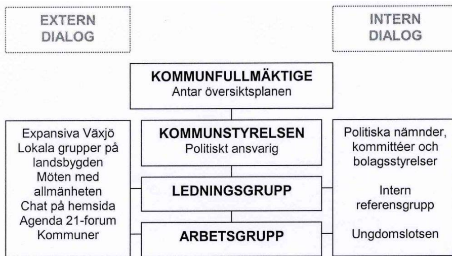
Bild: Projektorganisation för Översiktsplan för Växjö kommun 2005

Kommunstyrelsen (KS) fick i maj 2002 i uppdrag från kommunfullmäktige (KF) att påbörja arbetet med en ny översiktsplan för Växjö kommun. En ledningsgrupp bestående av kommunchef, stadsbyggnadskontorets förvaltningschef, kommunledningskontorets planeringschef och projektledare har ansvarat för arbetet. En arbetsgrupp på sju tjänstemän, inklusive projektledaren, har samordnat arbetet tillsammans med en intern referensgrupp bestående av ett 20-tal tjänstemän från kommunala förvaltningar och bolag. Politiska nämnder, kommittéer, bolagsstyrelser, intresseorganisationer, närliggande kommuner, länsstyrelsen, föreningar och allmänheten har fått kontinuerlig information om arbetet. Figuren nedan illustrerar projektorganisationen.