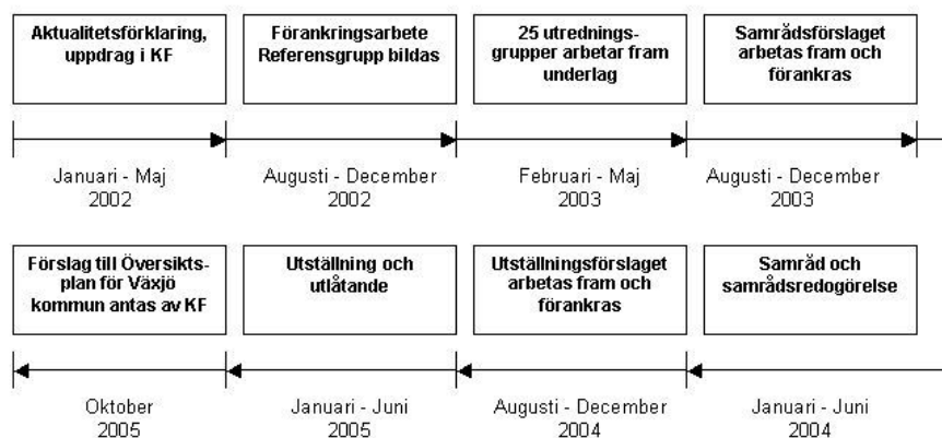
Bild: Arbetsprocessen som flödesschema

Det nya förslaget var utställt under februari-april 2005. Inkomna yttranden sammanställdes i ett utlåtande och förslaget justerades till en antagandehandling. Kommunfullmäktige antog ny översiktsplan för Växjö 2005-10-20.