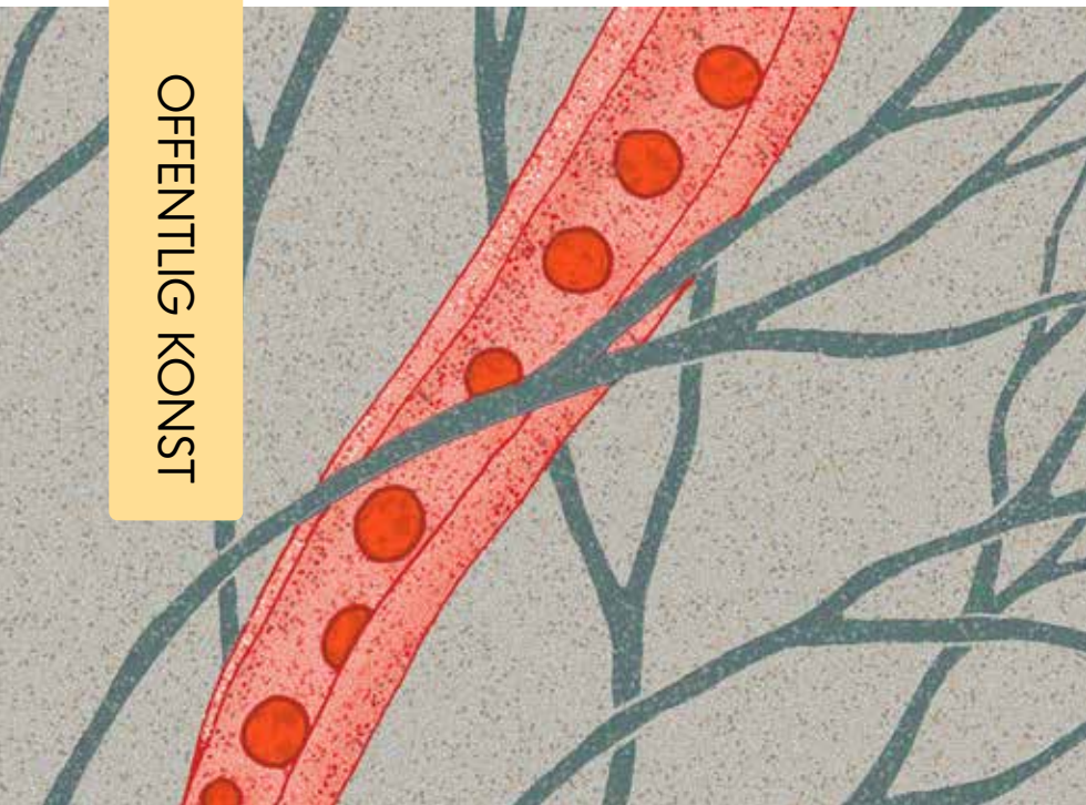
Skiss: Maja Droetto